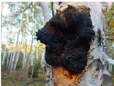
Figura 1: colonia di Chaga su albero di betulla

In etnomedicina si utilizza generalmente quello proveniente dalla Russia e dei paesi dell'Est europeo.